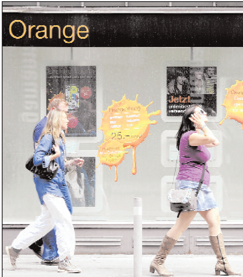
Le réseau mobile d'Orange Suisse, «quelque peu boiteux», nécessiterait de gros investissements pour être efficace à long terme.

C'est la grande différence avec Sunrise qui, au départ, était un opérateur de téléphonie fixe, puis a racheté l'opé-