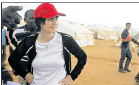
Micheline Calmy-Rey a visité le camp de Dadaab, au Kenya.

Et de rappeler que la Confédération a décidé il y a deux semaines de libérer 4,5 millions de francs supplémentaires pour soutenir cette région. Depuis le début de l'année, la Suisse, qui s'engage par le biais de l'aide humanitaire, a déjà versé près de 14 millions.